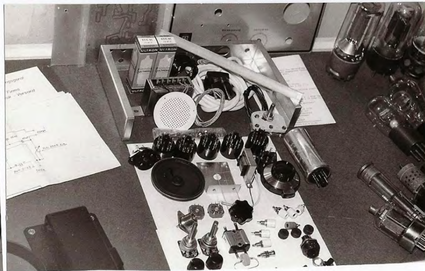
Links: Werbetafeln, rechts oben selbstgebauter 2-m-RX/TX ( schon Halbleitertechnik!), unten der Bausatz eines O-V-1