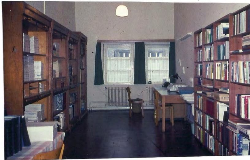
Oberes Foto: das Lager, unten Bücherei des DARC/VFDB (betreut von DJ1GE), rechts Morseunterricht mit DARC