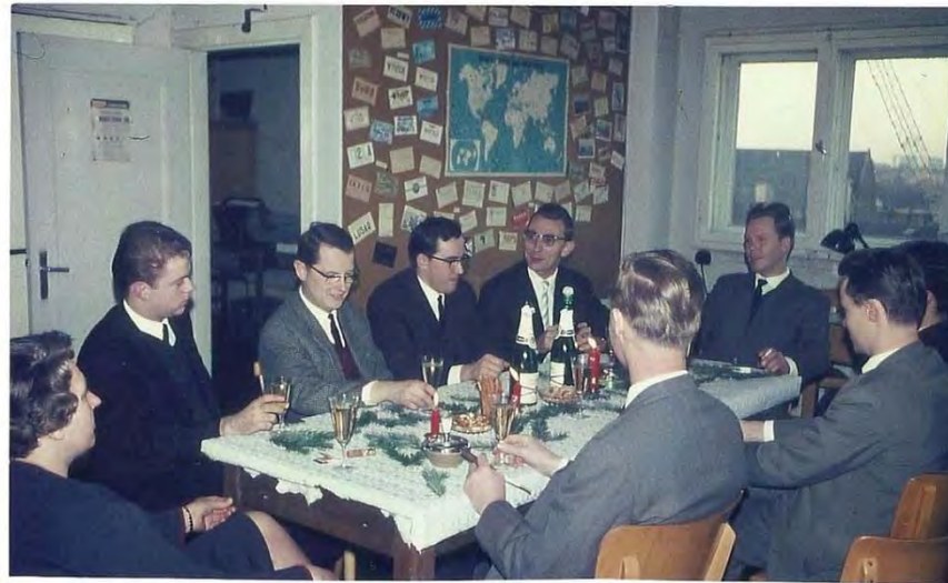
Oben links: „Werkstattidylle“, rechts: die neue, von Mitgliedern gebaute 2-m-Station als Bausteinversion (Sender mit Modulator, Netzteil und Empfänger Nogoton), unten: Weihnachtsfeier der Teilnehmer an den DLOHM-Runden 1966